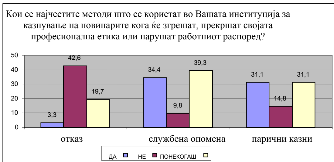
Графикон 2: Најчести санкции за новинарите

Најчесто користениот метод за казнување на новинарите за нивните грешки или прекршување на професионалната етика и работниот распоред е службената опомена. Чести се исто така и финансиските казни додека отказот претставува исклучок во санкционирањето на новинарите. (Графикон 2).